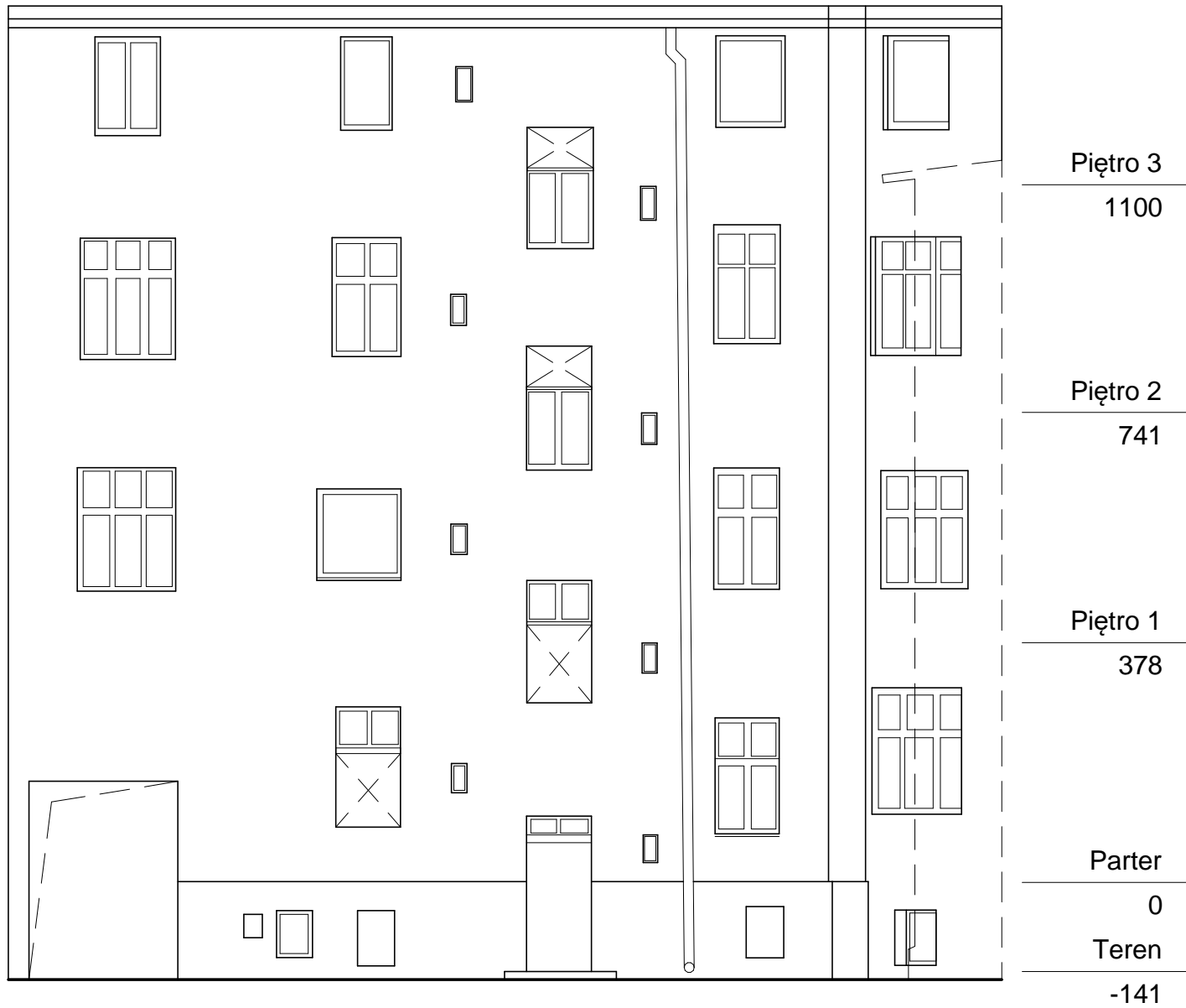
ELEWACJA PÓŁNOCNA (TYLNA) SKALA 1:100