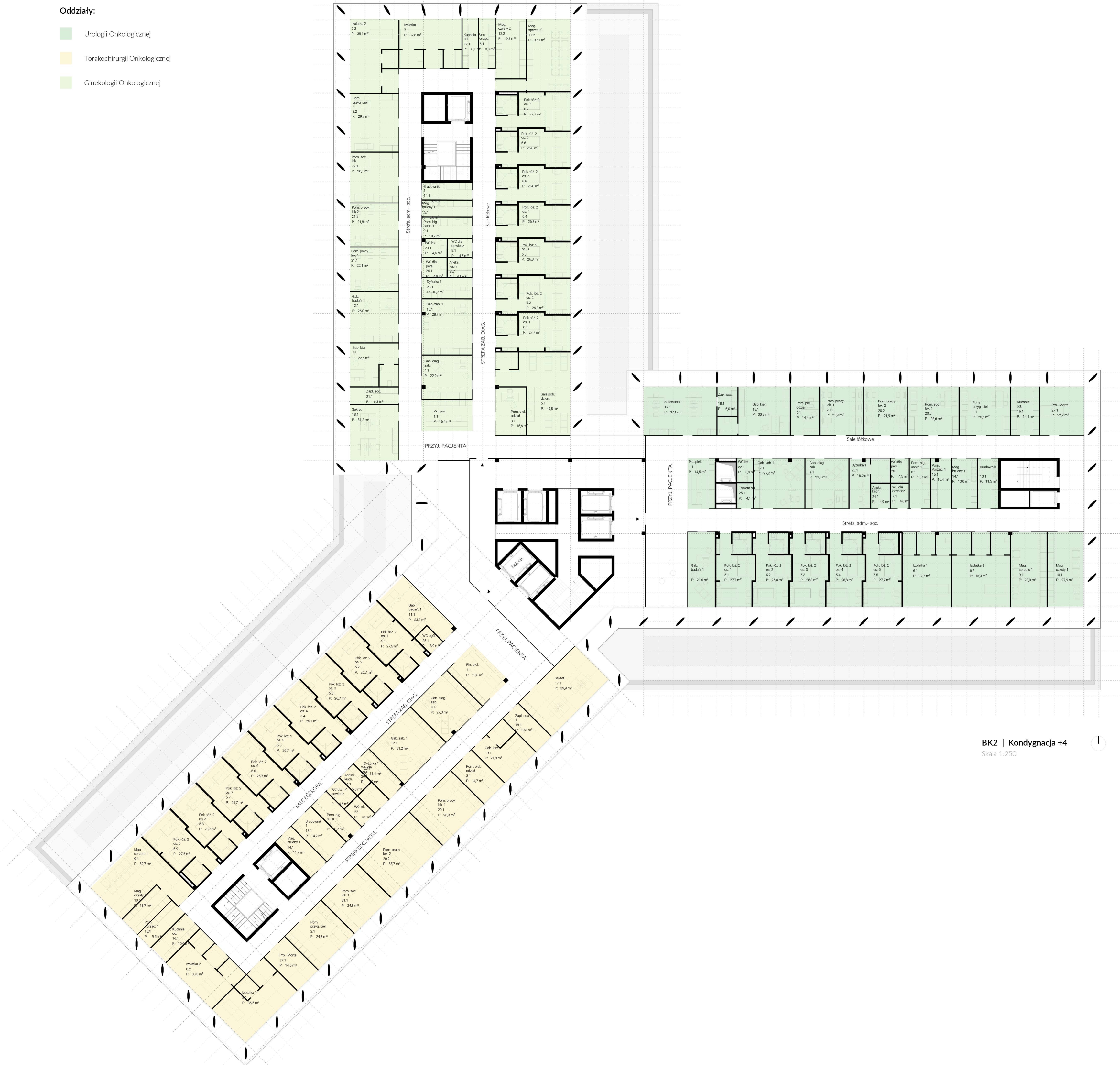
BK2 | Kondygnacja +4 Skala 1:250