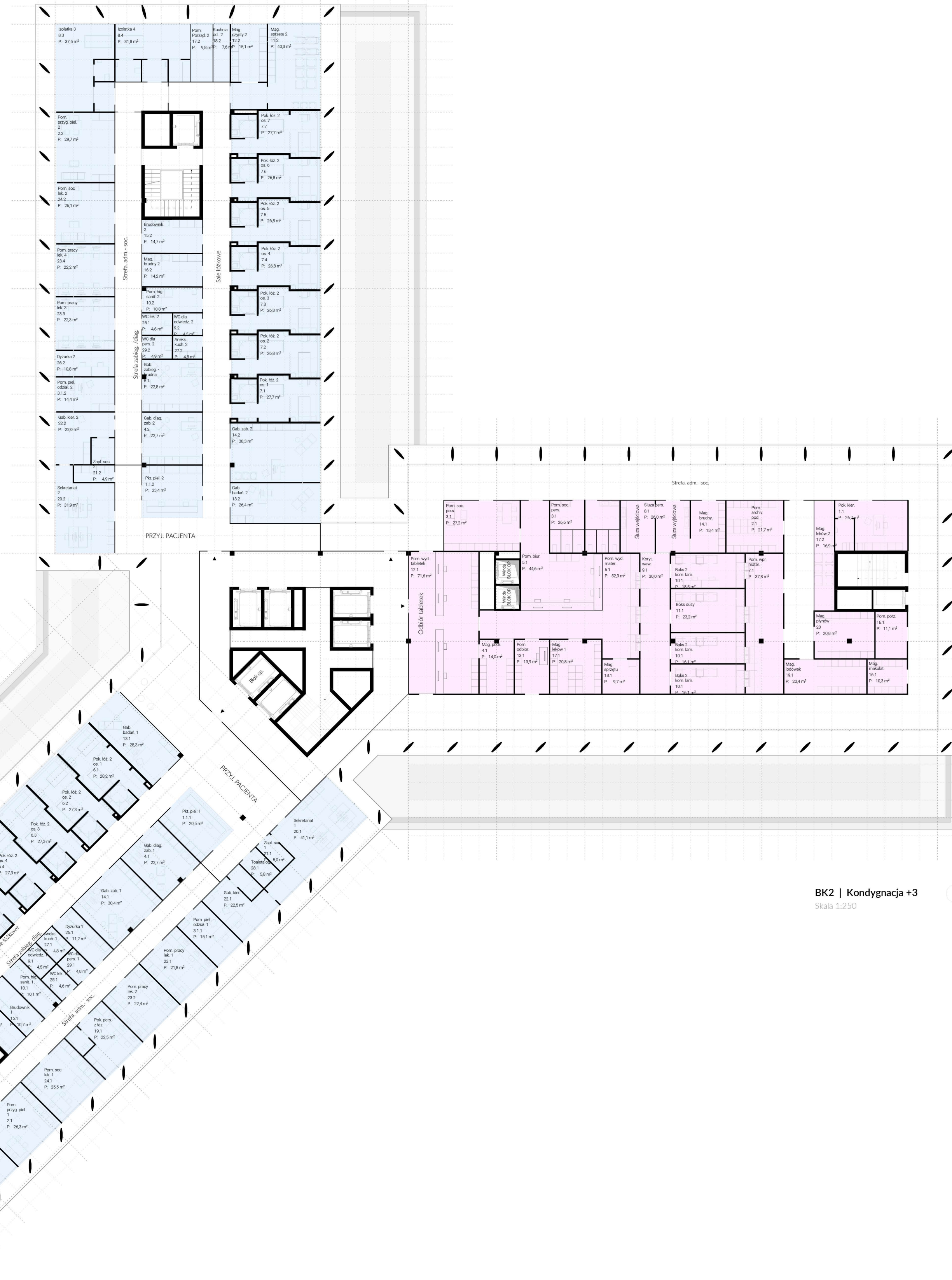
BK2 | Kondygnacja +3 Skala 1:250