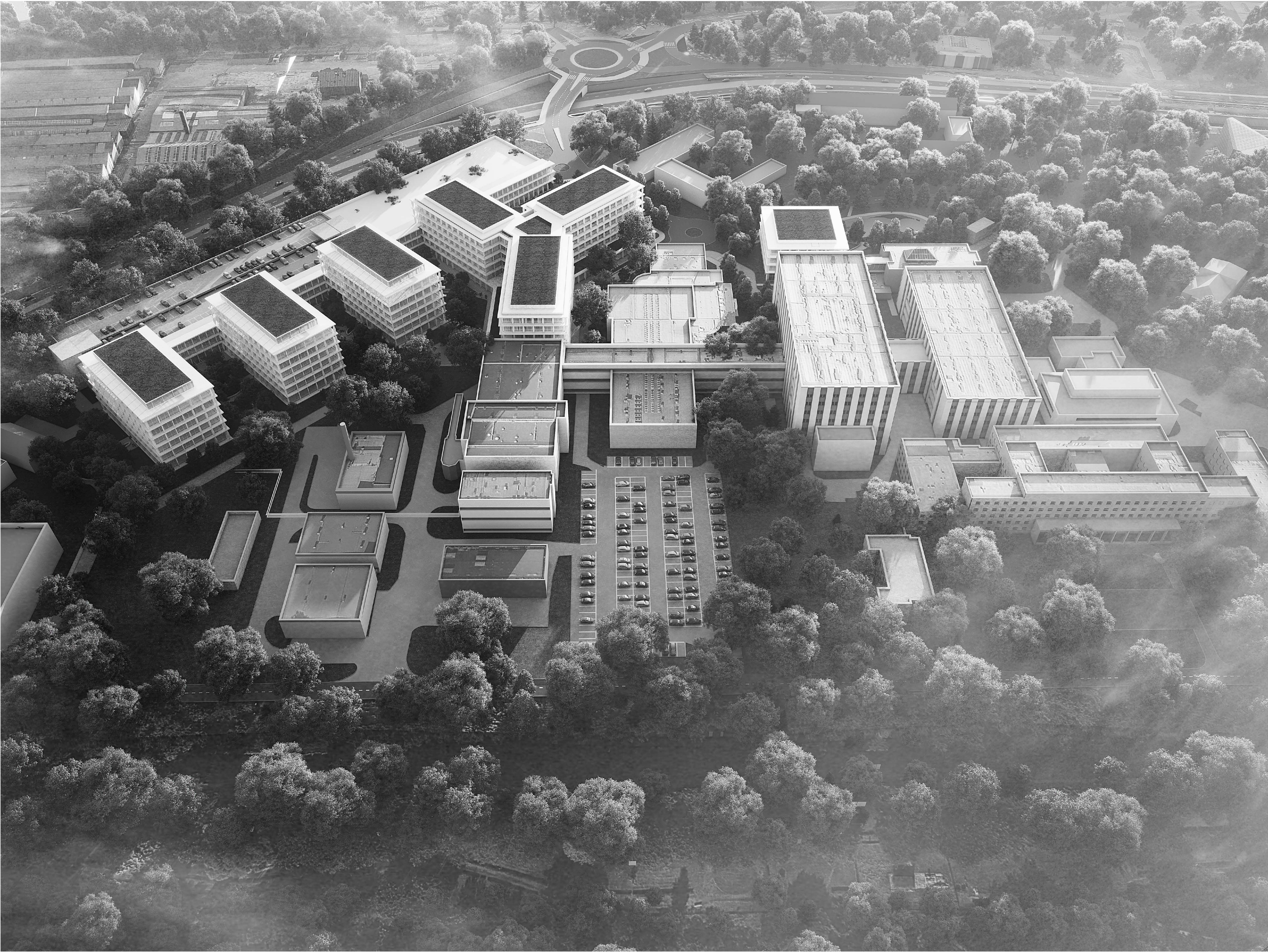
WIDOK | PROPONOWANY PLAN ROZWOJU NARODOWEGO INSTYTUTU ONKOLOGII OD STRONY ULICY WYBRZEŻA WOJSKA POLSKIEGO