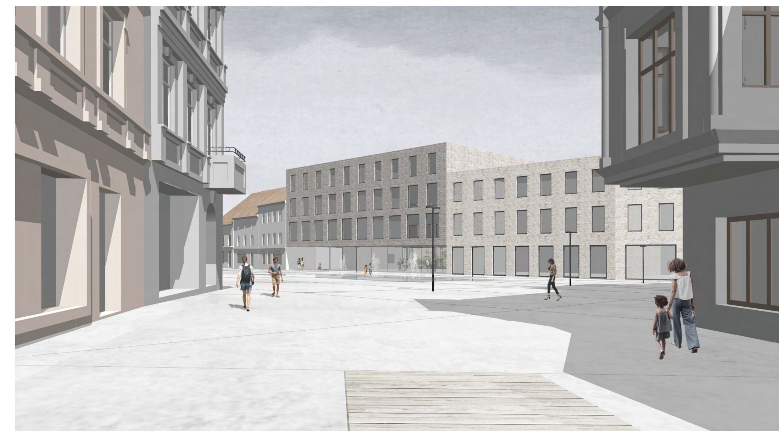
PÓŁNOCNA PIERZEJA RYNKU - WIDOK OD STRONY UL. GRUNWALDZKIEJ - FORMA DOCELOWA