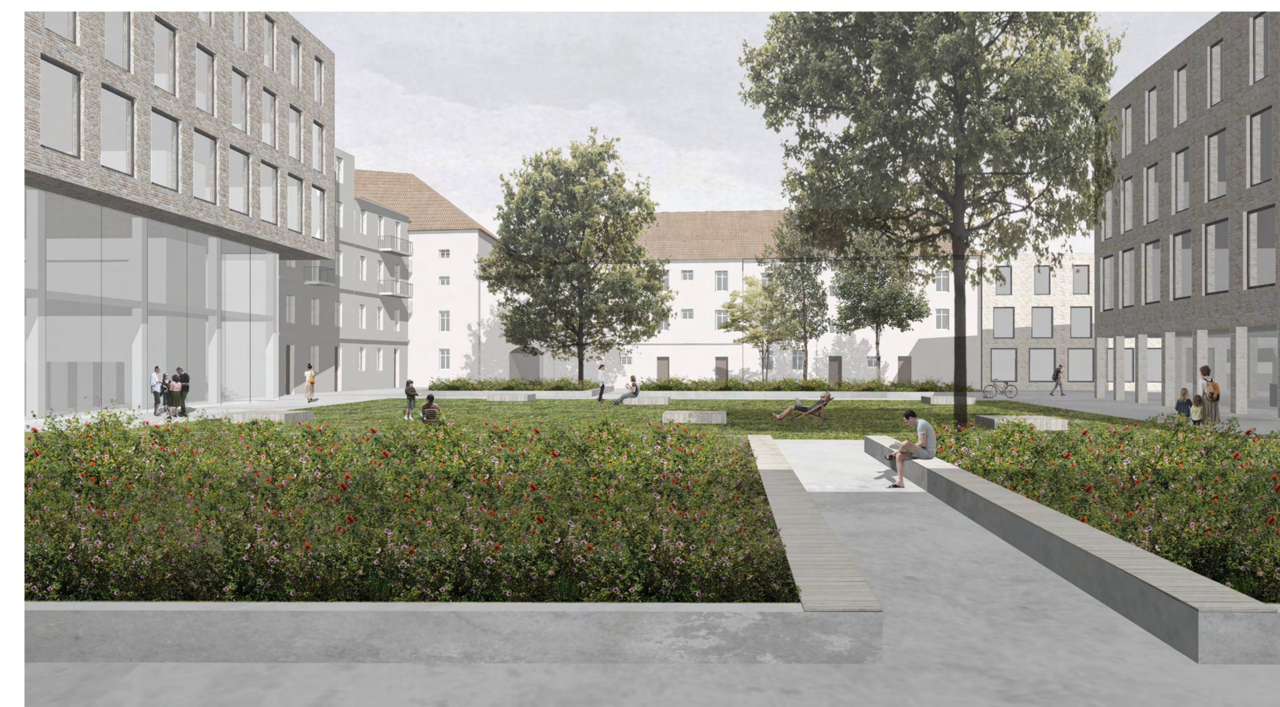
WNĘTRZE KWARTALU - FORMA DOCELOWA